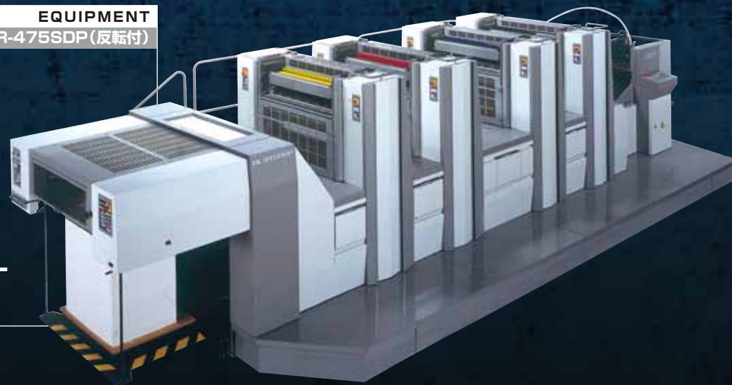
02 EQUIPMENT 印刷機 OLIVER-475SDP (反転付)