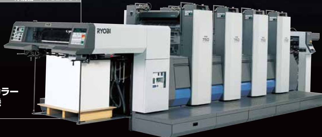
03 EQUIPMENT 印刷機 RYOBI754